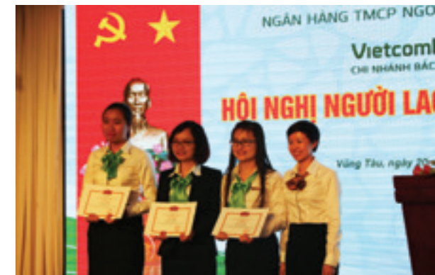
Tổ chức trao thưởng cho người lao động