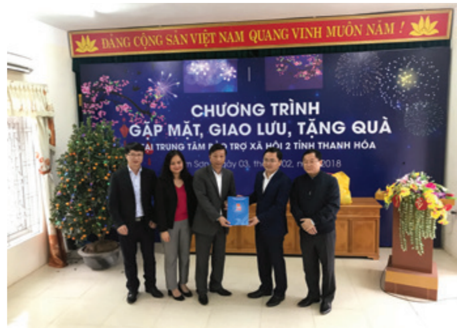
Đoàn Vietcombank Hà Thành tổ chức chương trình Giao lưu, tặng quà Tết tại Trung tâm bảo trợ xã hội 2 – tỉnh Thanh Hoá