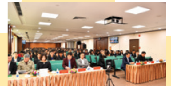
Toàn cảnh Hội nghị trực tuyến học tập, quán triệt, triển khai thực hiện Nghị quyết Hội nghị lần thứ 6 Ban chấp hành Trung ương Đảng (Khóa XII)