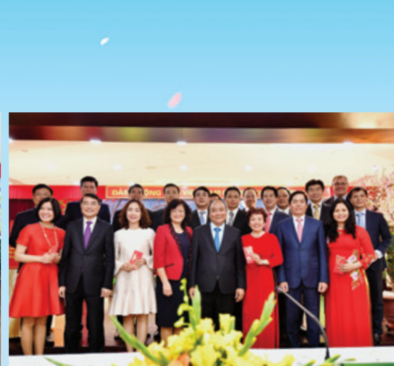
Đồng chí Nguyễn Xuân Phúc - Ủy viên Bộ Chính trị, Thủ tướng Chính phủ cùng Lãnh đạo NHNN, Đảng ủy Khối DNTW chụp hình lưu niệm cùng Ban Lãnh đạo Vietcombank

Chiều ngày 21/02/2018 (mùng 6 Tết Mậu Tuất), ngày làm việc đầu tiên của năm mới, Vietcombank vinh dự được đón tiếp Thủ tướng Chính phủ Nguyễn Xuân Phúc cùng các đồng chí lãnh đạo cấp cao của Đảng, Chính phủ, ngành Ngân hàng và Đảng ủy Khối DNTW đến thăm và chúc Tết tại Vietcombank.