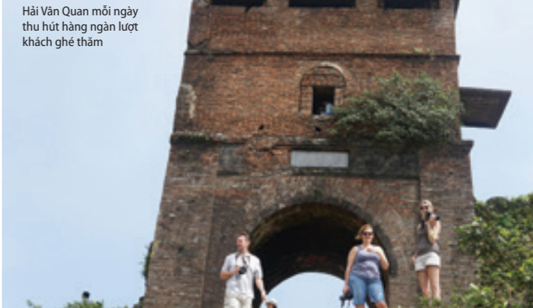
Hải Vân Quan mỗi ngày thu hút hàng ngàn lượt khách ghé thăm

Nếu cung đường Nam Hải Vân có nhiều điểm nút chân bạn dừng lại để ngắm nhìn toàn cảnh thành phố Đà Nẵng từ trên cao với bán đảo Sơn Trà mây phủ trắng đỉnh núi, cảng Tiên Sa lấp lánh tàu thuyền, cầu Thuận Phước như chiếc chiếc cầu vồng bắc qua sông Hàn và xa hơn nữa là Cù Lao Chàm thì cung đường Bắc Hải Vân sẽ mang đến cho bạn những trải nghiệm bất ngờ khi may mắn bạn có thể bắt gặp cả một đàn voọc chà vá chân nâu xuất hiện kiêu hãnh ven rừng như để khoe vẻ đẹp quý tộc của chúng.