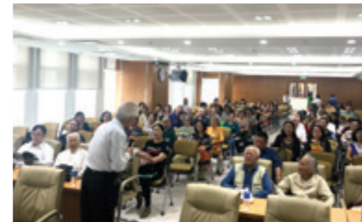
Không khí thân tình, vui tươi của buổi họp mặt hưu trí Vietcombank TP.HCM