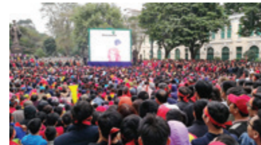
Đồng đảo cổ động viên, người hâm mộ và người dân Thủ đô theo dõi trận chung kết giữa U23 Việt Nam với U23 Uzbekistan trước màn hình LED do Vietcombank hỗ trợ lắp đặt tại Tượng đài Lý Thái Tổ

Trong suốt những ngày diễn ra giải vô địch U23 châu Á, Vietcombank đã luôn cùng hàng chục triệu người hâm mộ cả nước đồng hành cùng đội tuyển U23 Việt Nam, nhiệt thành cổ vũ cho một tình yêu bóng đá, thứ bóng đá đẹp như các cầu thủ U23 đã thể hiện.