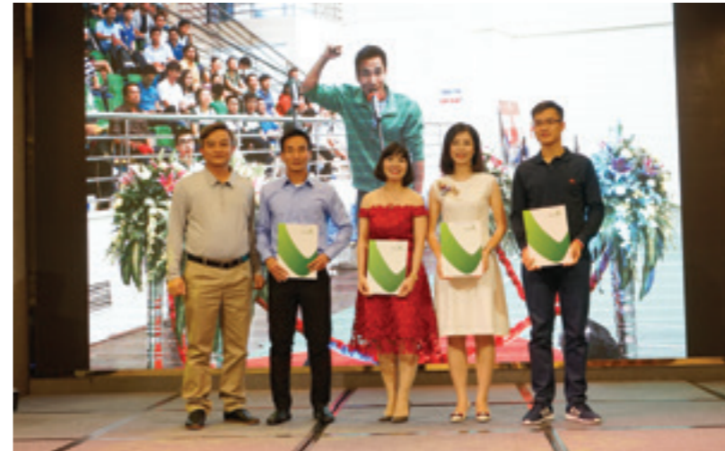
Cán bộ nhân viên Vietcombank Móng Cái tham gia Hội thao