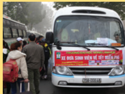
Các bạn sinh viên xếp hàng chờ lên xe về quê ăn Tết

Đây là lần đầu tiên trường Đại học Khoa học - Đại học Huế tổ chức chương trình này, sự đồng hành của Vietcombank Huế đối với chương trình một lần nữa khẳng định nỗ lực không ngừng của Vietcombank Huế đối với công tác ASXH.