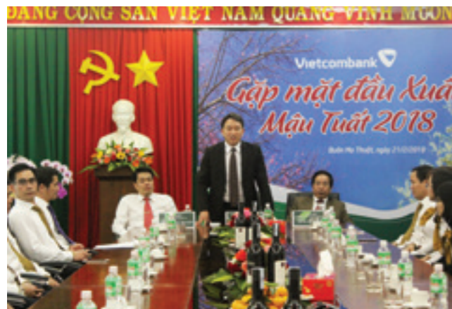
Đổng chí Nguyễn Hải Ninh - Ủy viên dự khuyết BCH TW Đảng, Phó Chủ tịch thường trực Ủy ban nhân dân tỉnh Đắk Lắk phát biểu tại buổi gặp mặt