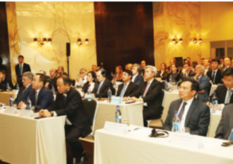
Chủ tịch HĐQT Vietcombank (ngồi thứ 3 từ phải sang của dãy bàn thứ 2) tham dự Toạ đàm doanh nghiệp Việt Nam – Bồ Đào Nha