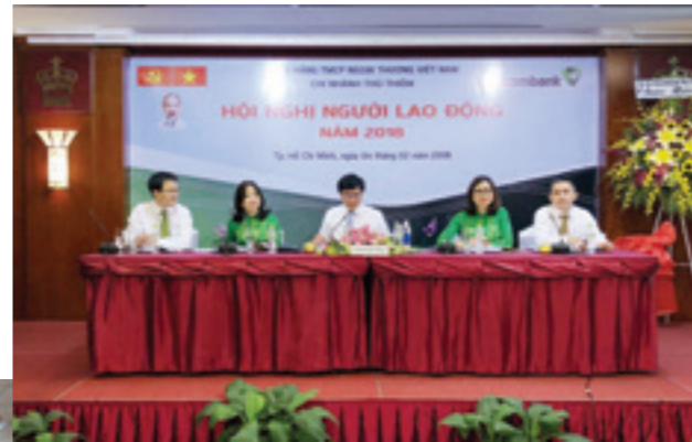
Đoàn chủ tịch điều hành Hội nghị