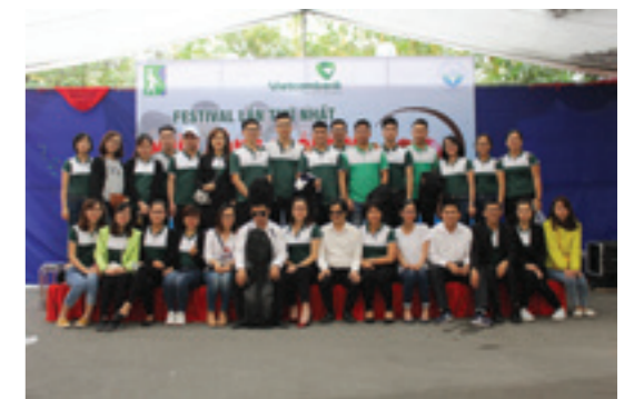
Vietcombank Bắc Ninh đồng hành cùng Festival Nhìn bằng trái tim

Để hỗ trợ công tác khắc phục hậu quả sau lũ, Vietcombank Leasing đã ủng hộ nhà trường các phần quà tặng bao gồm 40 bộ bàn ghế dành cho học sinh mầm non, 02 tủ để đồ dùng sinh hoạt, 02 đồ chơi ngoài trời và 40 bộ bát inox cùng một số bánh kẹo, nhu yếu phẩm khác, tổng trị giá 30 triệu đồng.