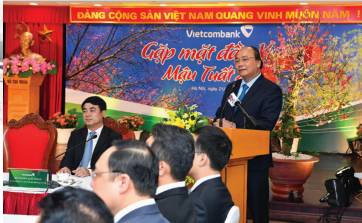
Đổng chí Nguyễn Xuân Phúc - Ủy viên Bộ Chính trị, Thủ tướng Chính phủ phát biểu chúc Tết tập thể lãnh đạo và cán bộ nhân viên Vietcombank