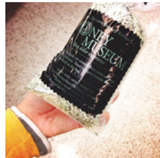
Gói tiền rác được tặng cho du khách miễn phí

Bảo tàng triển lãm tương tác được thiết kế để giải thích cách thức ngân hàng dự trữ liên bang hoạt động và cách thức chuyển tiền thông qua hệ thống ngân hàng vào nền kinh tế. Một trong những cuộc triển lãm thú vị nhất đập vào mắt du khách ngay khi bước vào khám phá là bộ sưu tập tiền xu giới thiệu từng loại đồng tiền do Hoa Kỳ sản xuất trong mỗi lần đương nhiệm của từng tổng thống. Bộ sưu tập cũng gợi nhớ đến năm 1953, sau nhiệm kỳ thứ hai của Harry S. Truman, với tư cách là Tổng thống của Hoa Kỳ, ông đã thuê văn phòng trên tầng thứ mười một của Fed có trụ sở tại 925 đường Grand ở trung tâm thành phố Kansas. Truman sử dụng không gian văn phòng cho đến khi thư viện mang tên Harry S. Truman mở cửa vào tháng 7/1957.