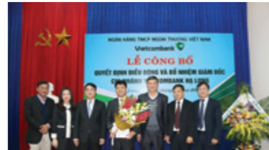
Lãnh đạo Ngân hàng Nhà nước tỉnh Quảng Ninh và lãnh đạo Vietcombank chụp hình lưu niệm cùng tân Giám đốc Vietcombank Hạ Long