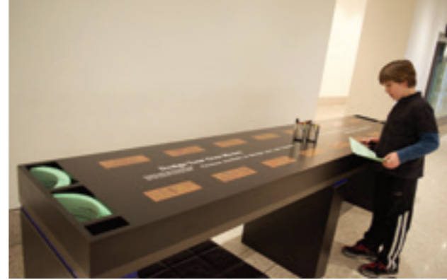
Trẻ em tương tác với hệ thống tiền tệ trong bảo tàng

Đi sâu vào trong, đằng sau bức tường kính ở phía sau hành lang là một sự hấp dẫn mạnh mẽ khi hàng khối tiền được sắp xếp và làm sạch, đưa qua máy kiểm đếm và bọc gói thành khối rồi theo xe ray tự động vận hành chạy vào hầm chứa, nơi lưu trữ hàng tỉ đô la tiền mặt trong đó mà không phải ai cũng vào được. Các tờ tiền giả mạo sẽ bị loại khỏi lưu thông và chuyển qua