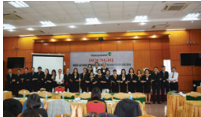
Ban lãnh đạo Vietcombank Hải Dương chụp hình lưu niệm tại Hội nghị

NGÀY 28/1/2018, TẠI TRỤ SỞ CHI NHÁNH, VIETCOMBANK HẢI DƯƠNG TỔ CHỨC THÀNH CÔNG HỘI NGHỊ NGƯỜI LAO ĐỘNG VÀ TRIỂN KHAI NHIỆM VỤ KINH DOANH NĂM 2018.