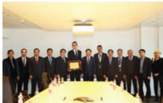
Phó Thủ tướng Chính phủ Vương Đình Huệ (thứ 7 từ phải sang) cùng đoàn các doanh nghiệp Việt Nam thăm và làm việc với Tập đoàn Zurich Airport tại Zurich, Thụy Sĩ