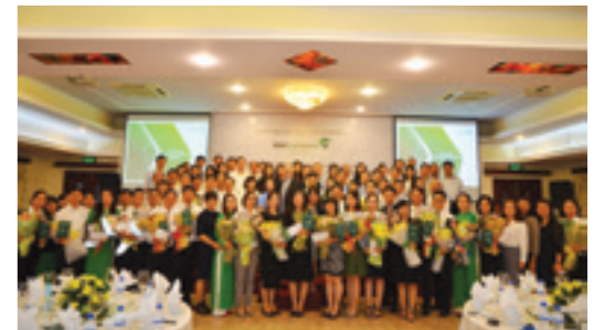
Lãnh đạo khối bán lẻ và đại diện 37 chi nhánh cùng các tập thể, cá nhân khu vực phía Nam đạt giải thi đua chụp ảnh kỷ niệm

Dịch vụ Ngân hàng điện tử; 7 tập thể đạt giải Khách hàng thể nhân CIF; 12 tập thể đạt giải thưởng Thẻ; 14 cá nhân đạt giải thưởng Tín dụng thể nhân; 19 cá nhân đạt giải thưởng Tín dụng SME; 36 cá nhân đạt giải thưởng Thẻ.