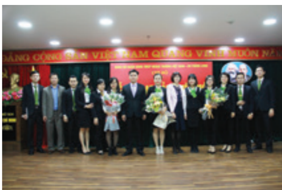
Các Đảng viên mới chụp hình lưu niệm cùng Ban giám đốc Vietcombank Thăng Long