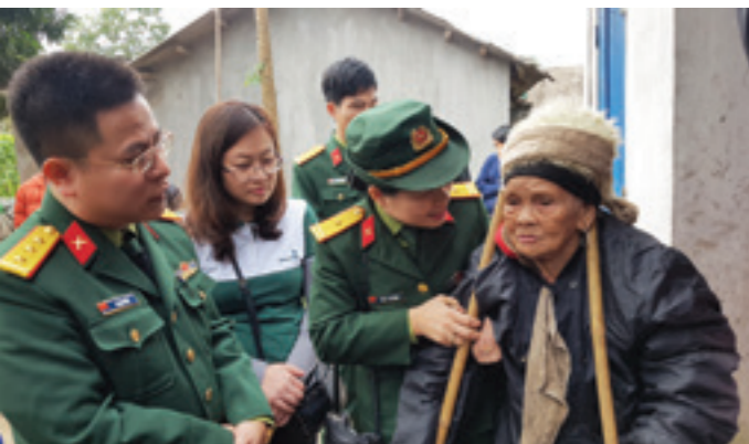
Đại diện Vietcombank Quảng Ninh và TCT Đông Bắc đến thăm hỏi và tặng quà cho các hộ gia đình nghèo tại thôn Loông Toông, huyện Ba Chẽ