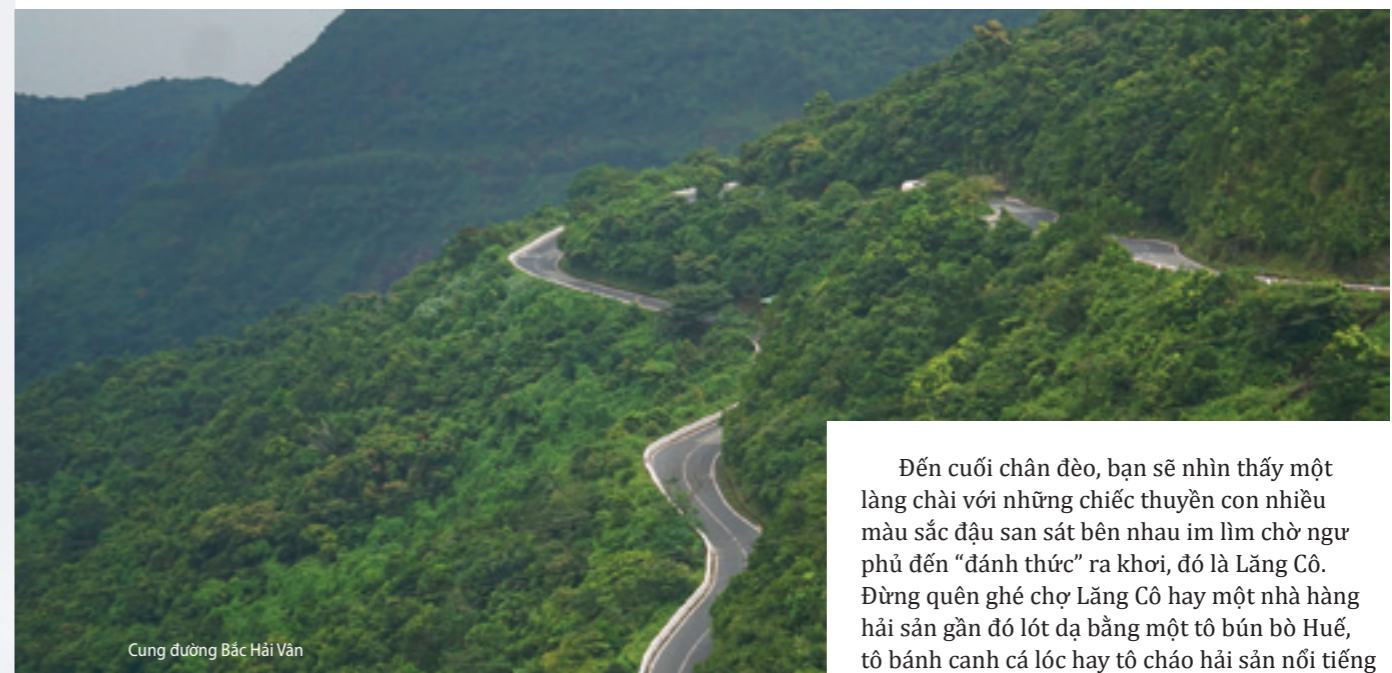
Cung đường Bắc Hải Vân

Nếu cung đường Nam Hải Vân có nhiều điểm nút chân bạn dừng lại để ngắm nhìn toàn cảnh thành phố Đà Nẵng từ trên cao với bán đảo Sơn Trà mây phủ trắng đỉnh núi, cảng Tiên Sa lấp lánh tàu thuyền, cầu Thuận Phước như chiếc chiếc cầu vồng bắc qua sông Hàn và xa hơn nữa là Cù Lao Chàm thì cung đường Bắc Hải Vân sẽ mang đến cho bạn những trải nghiệm bất ngờ khi may mắn bạn có thể bắt gặp cả một đàn voọc chà vá chân nâu xuất hiện kiêu hãnh ven rừng như để khoe vẻ đẹp quý tộc của chúng.