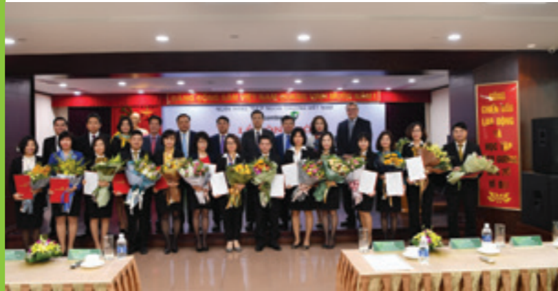
Ban lãnh đạo Vietcombank chụp hình lưu niệm cùng các cán bộ được điều động và bổ nhiệm