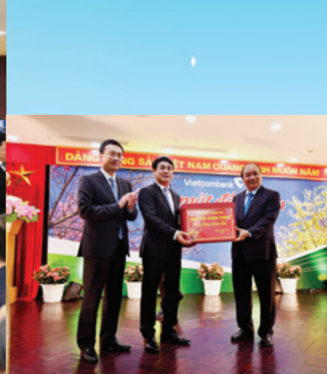
Đồng chí Nguyễn Xuân Phúc - Ủy viên Bộ Chính trị, Thủ tướng Chính phủ (bên phải) tặng quà cho Ban Lãnh đạo và tập thể CBNV Vietcombank