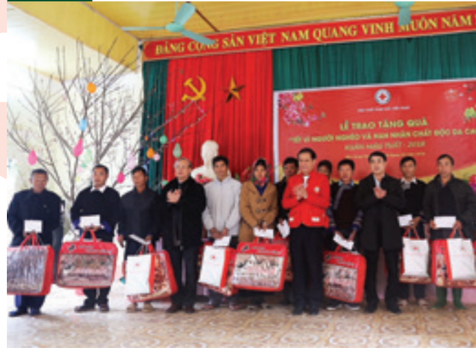
Đ/c Trần Quốc Vượng - Ủy viên Bộ Chính trị, Thành viên Thường trực Ban Bí thư, Chủ nhiệm Ủy ban Kiểm tra T.Ư (thứ 4 từ trái sang) cùng đại diện Lãnh đạo Hội Chữ thập đỏ Việt Nam và Vietcombank tặng quà các hộ gia đình nghèo, hộ bị ảnh hưởng do thiên tai trên địa bàn các huyện thuộc tỉnh Yên Bái