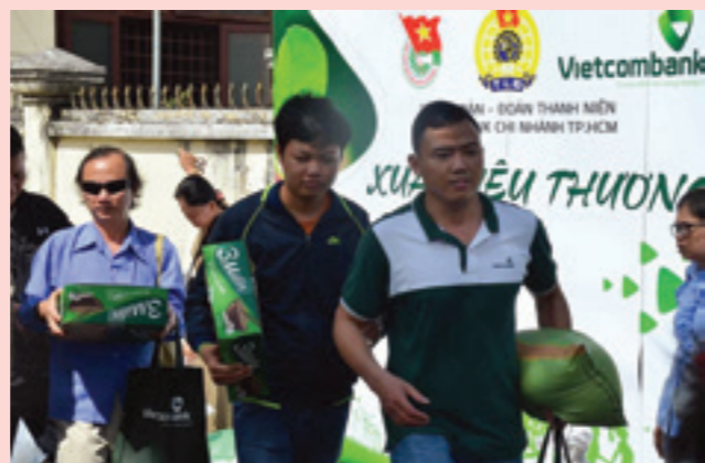
Những hình ảnh ấm áp nghĩa tình của chuyến thiện nguyện “Xuân yêu thương”

Chương trình nghệ thuật đã diễn ra sôi nổi trong không khí tươi vui của mùa Xuân. Tình yêu quê hương đất nước, khơi dậy niềm tin tưởng, tự hào dân tộc, hướng về Tổ quốc và tinh thần đoàn kết trong nhân dân và Kiều bào ta ở nước ngoài được thể hiện qua nhiều ca khúc như: Hello Việt Nam, Rạng rỡ Việt Nam, Nắng có còn xuân, Xuân Quê hương, Quê nhà... với sự tham gia của các nghệ sĩ nổi tiếng trong và ngoài nước.