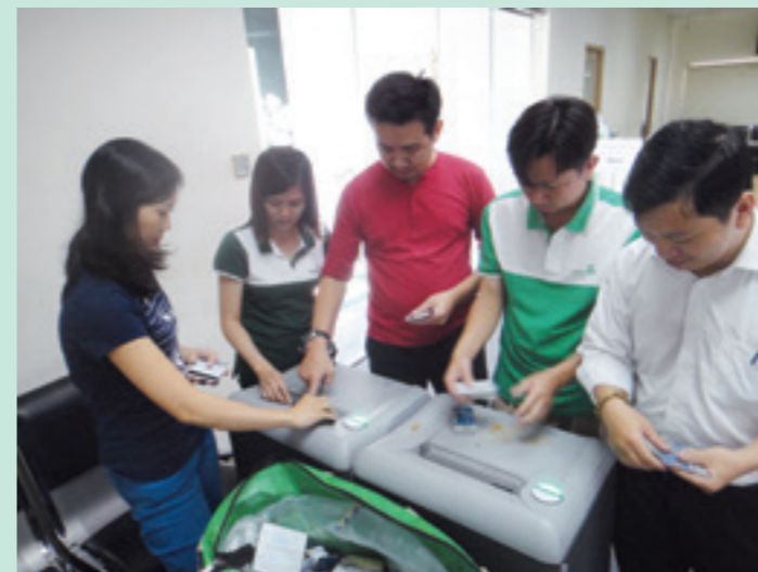
Vietcombank Thủ Đức sử dụng máy cắt vụn thật nhỏ các loại thẻ và đưa tiêu hủy