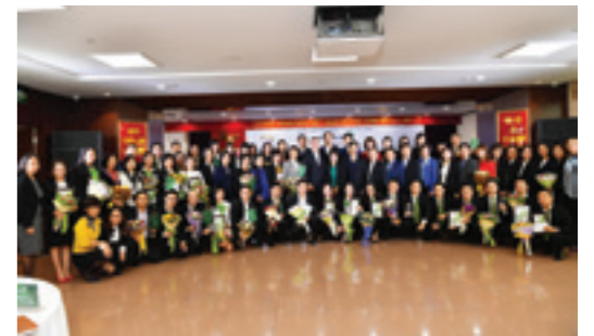
Lãnh đạo khối bán lẻ và đại diện 34 chi nhánh cùng các tập thể, cá nhân khu vực phía Bắc đạt giải thi đua chụp ảnh kỷ niệm

Kết quả thi đua bán SPDV NHBL quý III/2017, Vietcombank khen thưởng 85 tập thể, 69 cá nhân thuộc Khối bán lẻ đạt giải thưởng bán hàng Tín dụng thể nhân. Cụ thể, Vietcombank khen thưởng 40 tập thể đạt giải thưởng Tín dụng thể nhân: 16 tập thể đạt giải Huy động vốn; 10 tập thể đạt giải