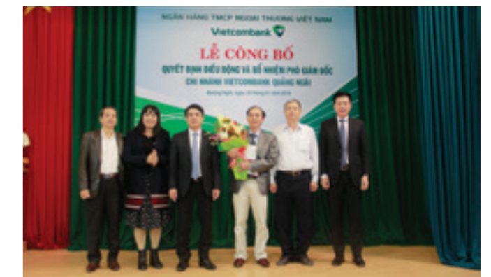
Lãnh đạo Ngân hàng Nhà nước tỉnh Quảng Ngãi và Lãnh đạo Vietcombank chụp hình lưu niệm cùng tân Phó Giám đốc Vietcombank Quảng Ngãi