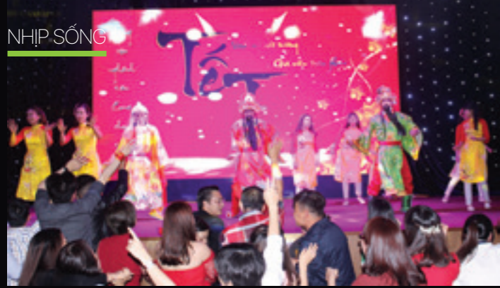
Hát múa: Khai Xuân Đón Lộc của liên quân các PGD