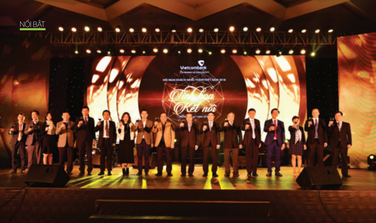
Các đại biểu khách mời cùng đại diện Ban Lãnh đạo Vietcombank và Vietcombank Sở Giao dịch tri ân khách hàng tại sự kiện