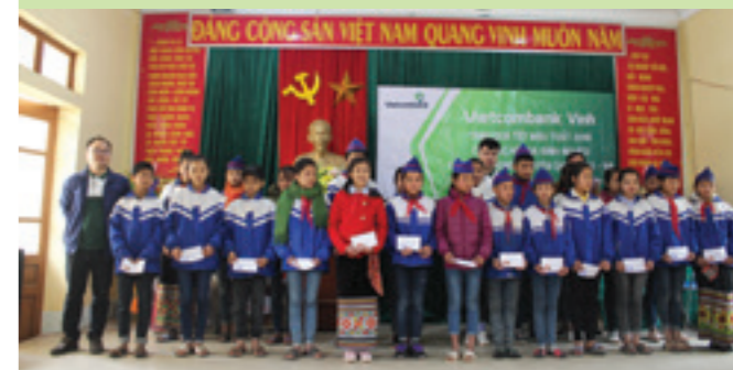
Đoàn Vietcombank Vinh tặng quà cho các học sinh nghèo tại Trường THCS Châu Phong, Quỳnh Châu, Nghệ An

Những món quà tuy nhỏ bé nhưng hết sức thiết thực và là tình cảm chân thành của toàn bộ CBNV Vietcombank Vinh gửi gắm, mong muốn sẽ chia sẻ sự khó khăn thiếu thốn, góp phần giúp đỡ đồng bào nghèo có thêm cái Tết đủ đầy hơn.