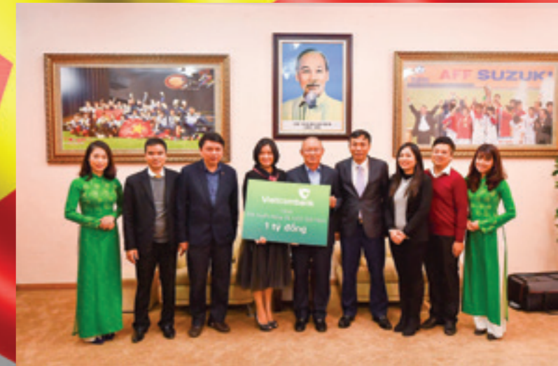
Đại diện Lãnh đạo VFF cùng Lãnh đạo và cán bộ Vietcombank chụp hình lưu niệm với Huấn luyện viên trưởng Park Hang Seo tại buổi Lễ trao tặng