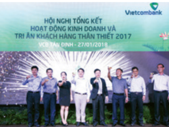
Ban Giám đốc Vietcombank Tân Định và khách hàng thực hiện nghi thức khai tiệc tại Hội nghị