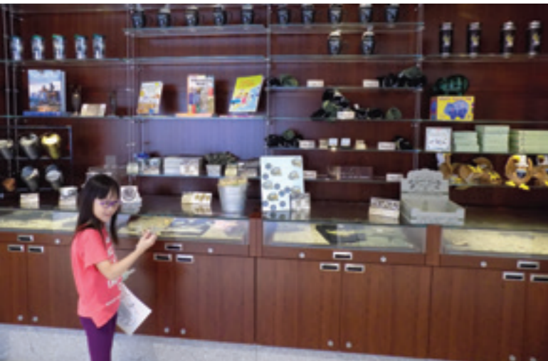
Cửa hàng lưu niệm The Vault