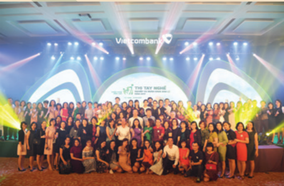
Đêm trao giải Thi tay nghề NHBL năm 2017 của Vietcombank