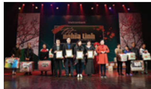
Đại diện Vietcombank (hàng đầu ngoài cùng bên trái) nhận kỷ niệm chương của Ban Tổ chức