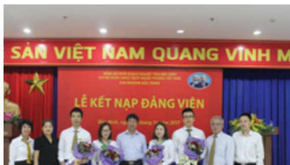
Lễ kết nạp 04 đảng viên mới chi bộ Vietcombank Bắc Ninh