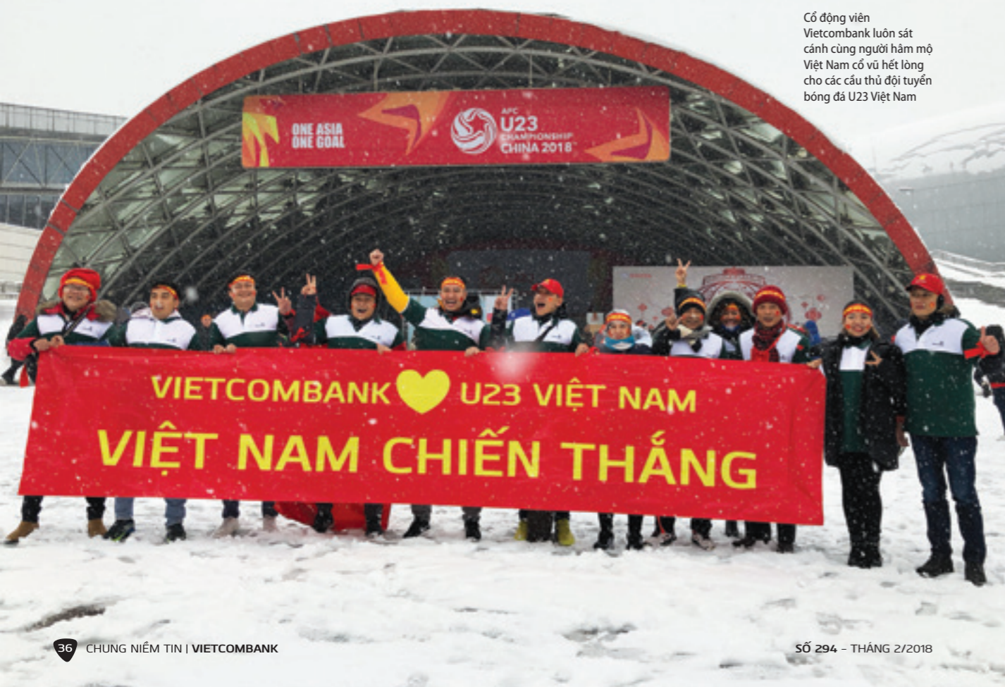
Có động viên Vietcombank luôn sát cánh cùng người hâm mộ Việt Nam cổ vũ hết lòng cho các cầu thủ đội tuyển bóng đá U23 Việt Nam

NGÀY 31/01/2018, TẠI TRỤ SỞ LIÊN ĐOÀN BÓNG ĐÁ VIỆT NAM (VFF) ĐÃ DIỄN RA LỄ TRAO TẶNG VÀ TIẾP NHẬN SỐ TIỀN 1 TỶ ĐỒNG CỦA VIETCOMBANK TẶNG ĐỘI TUYỂN BÓNG ĐÁ U23 VIỆT NAM ĐẠT THÀNH TÍCH CAO TẠI TAI GIẢI VÔ ĐỊCH BÓNG ĐÁ U23 CHÂU Á.