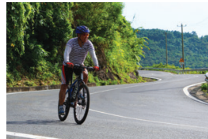
Phiêu cùng mây trời Hải Vân

Đến cuối chân đèo, bạn sẽ nhìn thấy một làng chài với những chiếc thuyền con nhiều màu sắc đậu san sát bên nhau im lìm chờ ngư phủ đến “đánh thức” ra khơi, đó là Lăng Cô. Đừng quên ghé chợ Lăng Cô hay một nhà hàng hải sản gần đó lót dạ bằng một tô bún bò Huế, tô bánh canh cá lóc hay tô cháo hải sản nổi tiếng vừa ngon vừa rẻ, rồi rong ruổi một vòng đầm Lập An tĩnh lặng đẹp đến ngỡ ngàng. Thủy triều xuống, những người dân địa phương lội xuống đầm đào những đụn cát tìm bắt hải sâm, dưới ánh mặt trời lấp lánh nhuộm đỏ chân mây.