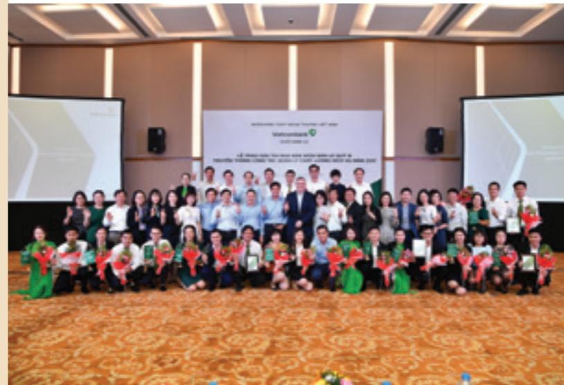
Lãnh đạo khối bán lẻ và đại diện 23 chi nhánh cùng các tập thể, cá nhân được trao thưởng chụp ảnh kỷ niệm