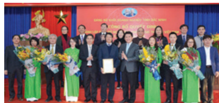
Lãnh đạo Đảng ủy khối Doanh nghiệp tỉnh, NHNN tỉnh Bắc Ninh chúc mừng và trao quyết định thành lập Đảng bộ Vietcombank Bắc Ninh

CĐCS đã tổ chức các đoàn thăm hỏi, động viên và tặng quà trực tiếp tới 216 hộ nghèo tại địa bàn phường Đại Phúc, Từ Sơn, Quế Võ, Yên Phong, Thuận Thành, Phù Chẩn. Đây là hoạt động thường niên mỗi dịp Tết đến Xuân về của Chi nhánh với tổng số tiền tài trợ là 76 triệu đồng, trong đó được hỗ trợ của Công đoàn Trụ sở chính 35 triệu đồng, phần còn lại do CBNV chi nhánh tự đóng góp với mức tối thiểu là 250.000 đồng/cán bộ.